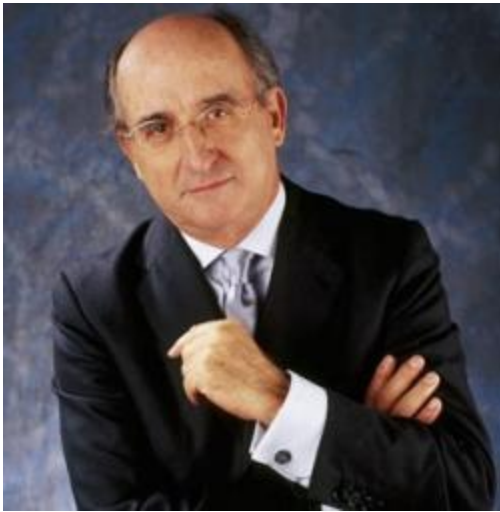
El presidente de Repsol, Antonio Brufau.